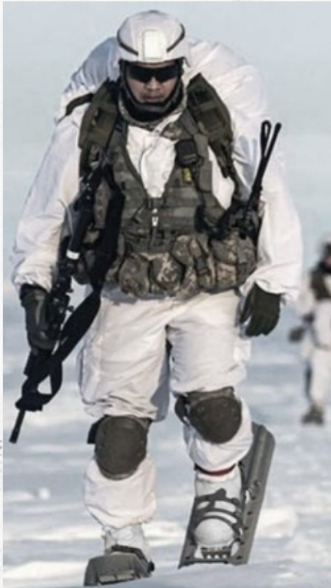
Conçue spécifiquement pour une utilisation militaire dans des environnements de froid extrême.

La « Bunny Boot » est le surnom le plus courant de la botte Extreme Cold Vapor Barrier. Cette grande botte bulbeuse en caoutchouc imperméable peut être portée dans les conditions les plus glaciales, de -29^{\circ}\text{C} à -51^{\circ}\text{C} ( -20^{\circ}\text{F} à -60^{\circ}\text{F} ). L'intérieur sans doublure conserve la chaleur en prenant en sandwich jusqu'à un pouce d'isolation en laine et en feutre entre deux couches de caoutchouc étanches à vide.